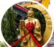
ผูกถ่ายแดง วัดห้วงท่าเซียน