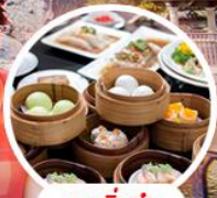
เมนูถิ่นชา