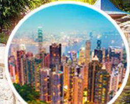
จุดชมวิว วิวทิวเขียวกว้าง